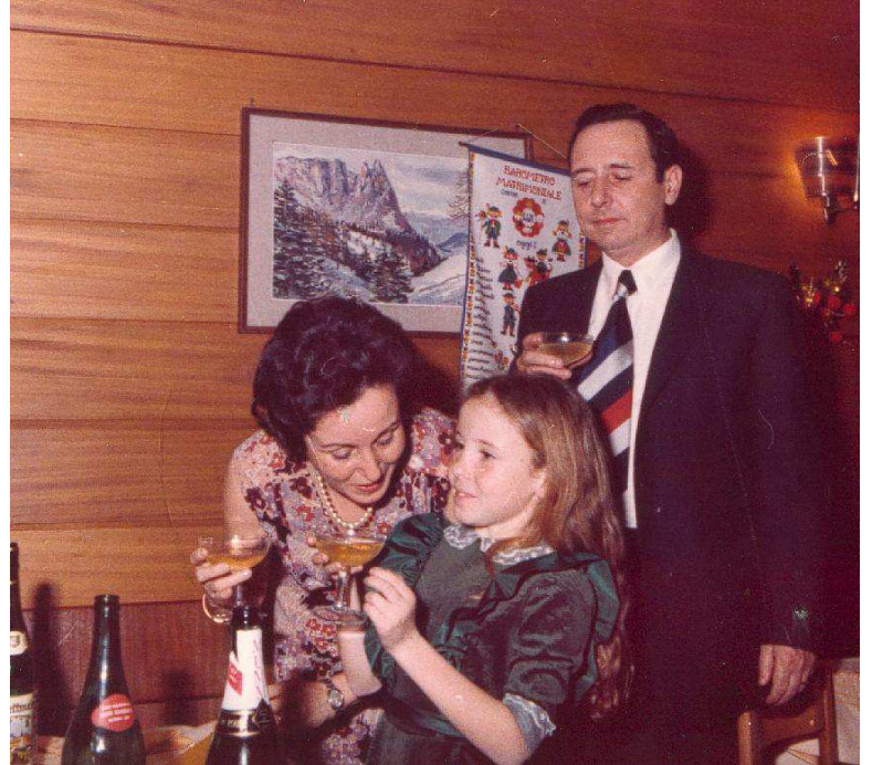
Cenone del'Ultimo dell'Anno All'Hotel Piccolo Sciliar a l'Alpe di Siusi